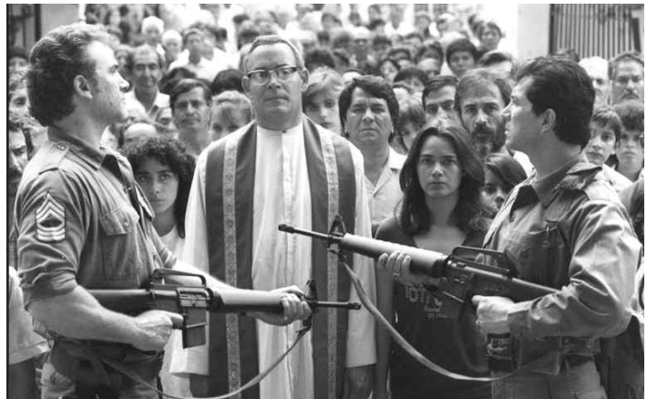
↳ 영화 '로메로'의 한 장면

로메로 대주교는 수시로 자신을 향해 독재정권이 협박과 위협을 가할 때마다 죽음을 예감하며 다음과 같은 말을 남깁니다. "저는 자주 죽음의 위협을 느꼈습니다. 그러나 그들이 저를 죽일 때 저는 엘살바도르 사람들의 가슴에 다시 살아날 것입니다. 제가 흘린 피는 자유의 씨앗이 되고 희망이 곧 실현되리라 는 신호가 될 것입니다. 사제는 죽을 지라도 하느님의 교회인 민중은 영원히 죽지 않을 것입니다."